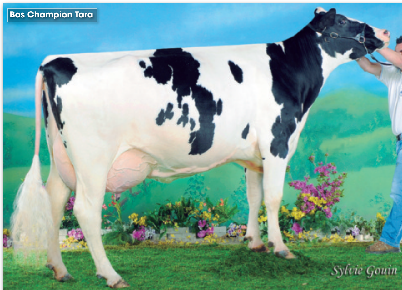
Bos Champion Tara

No podíamos continuar esta sección sobre las familias más destacadas de vacas españolas sin hacer un repaso a la familia TARA, posiblemente una de las más importantes de la nuestra genética. Entre sus descendientes encontraremos vacas excelentes, novillas genómicas entre las 50 mejores, vacas con producciones superiores a los 50.000 kilos y algunos toros de inseminación.