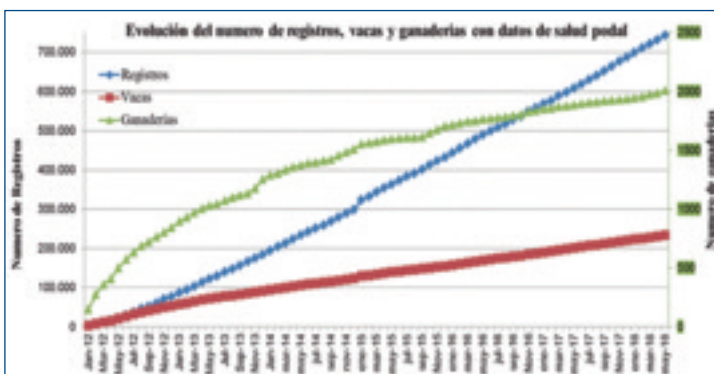
Gráfico 1. Evolución de los datos de salud podal en la base de datos del I-SAP desde su inicio hasta mayo 2018.

Noureddine Charfeddine 1 y M a Ángeles Pérez-Cabal 2